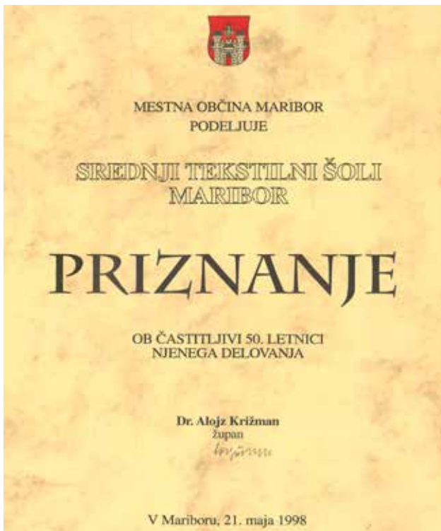
Priznanje Mestne občine Maribor ob jubileju

Za vsebino so poskrbeli dijaki in učitelji STeŠ. Vsebinsko zbornik zajema zgodovinski pregled izobraževanja tekstilcev in frizerjev v Mariboru, kroniko, predstavljeni so bivši ravnatelji, učitelji in zunanji sodelavci šole, življenje in delo v šoli, literarni prispevki dijakov.