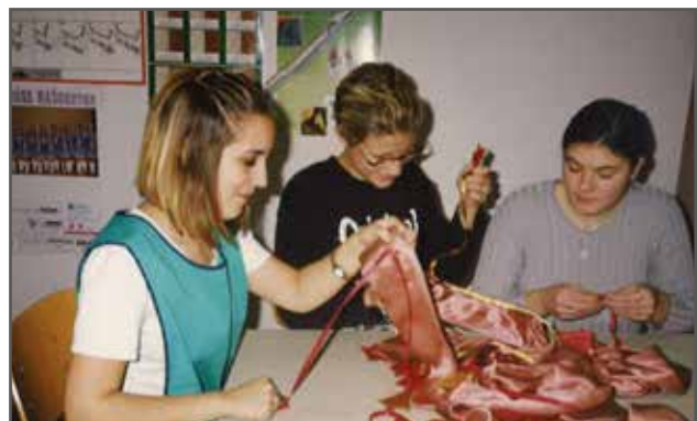
Dijaki pri praktičnem pouku