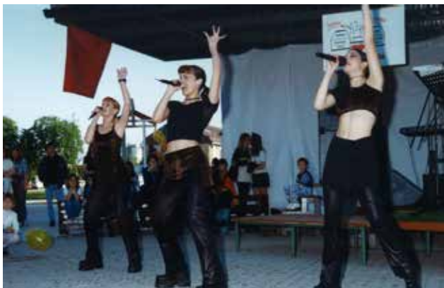
Prireditev Živilko in tekstilko pojeta na dvorišču šol