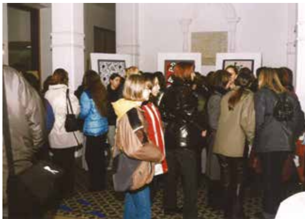
Odprte razstave v Narodnem domu

Dijaki/-inje so tudi literarni ustvarjalci. Ob otvoritvi novega šolskega poslopja je šolsko glasilo dobilo novo ime – Besedoprejka. V šolskem letu 2000/01 je šolsko glasilo Škarjice združilo literarne ustvarjalce vseh programov v šoli in zamenjalo dotedanji glasili Besedoprejka in Kodrčki. Prva generacija modnih oblikovalcev je decembra 1999 pripravila svoje glasilo Modne iskrice, v katerem je predstavila svoje zamisli in predloge, kako se obleči ob raznih priložnostih. Angleško in nemško pišoči dijaki pa so svoje prispevke objavljali v glasilu Needles and Clips – Nadeln und Spangen. Na zaključni prireditvi junija 2003 v Narodnem domu so dijaki vseh programov prispevali vsebino za šolski časopis Divjak, natisnili pa so ga medijski tehniki.