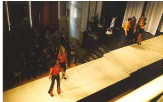
Modna pista v Narodnem domu

Na srečanju Mladi za napredek Maribora naši dijaki vsako leto precej uspešno so-