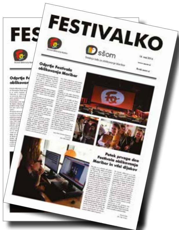
Časopis Festivalko, ki je izhajal 3 dni v času FOMB-a