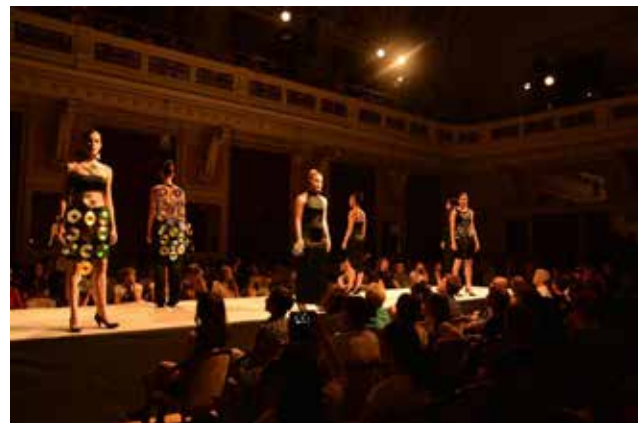
Festival frizerskih, oblikovnih in tekstilnih šol Slovenije