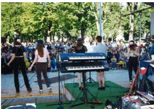
Nastop dijakov na prireditvi Živilko in tekstilko pojeta