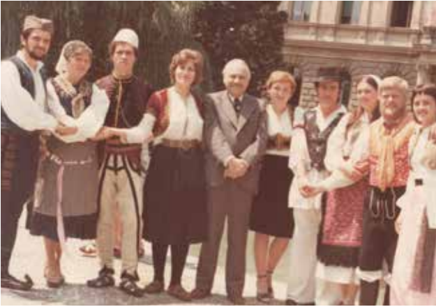
Dijaki konfekcijske modelarske šole v narodnih nošah nekdanjih jugoslovanskih republik