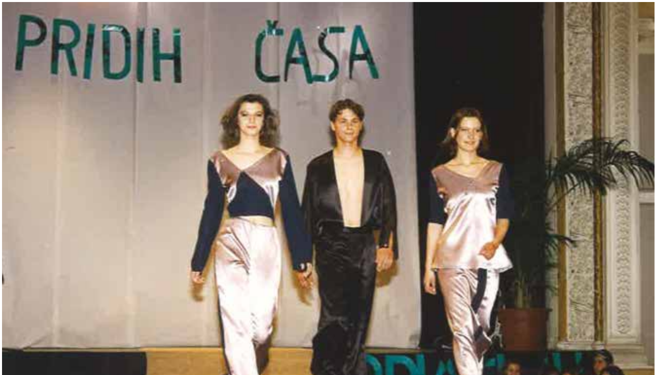
Zaključna prireditev v Narodnem domu