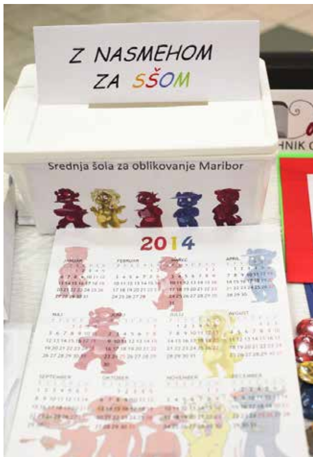
Predstavitev izdelkov programa medijski tehnik