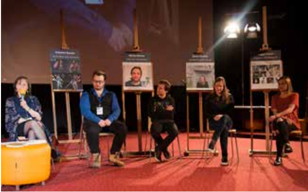
Dan oblikovalcev na prvem Festivalu oblikovanja Maribor 2016