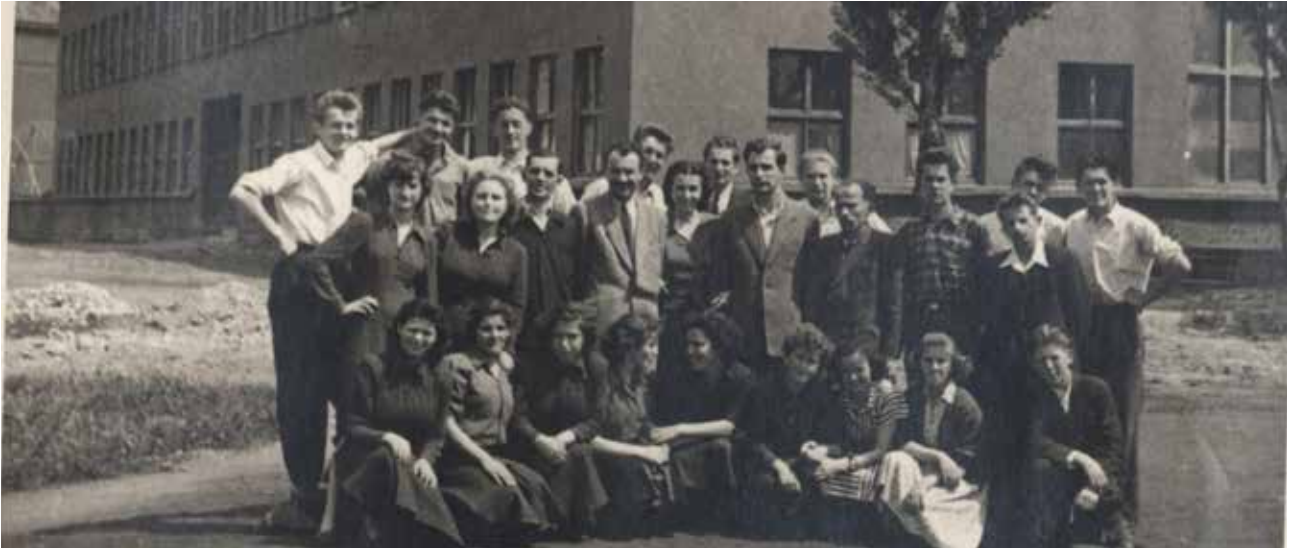
Absolventi-tkalci 3.b razreda Industrijske tekstilne šole 1950–51 Fotografija: Pokrajinski arhiv Maribor, SI_PAM/1778 Samuda Heribert, škatla 9.