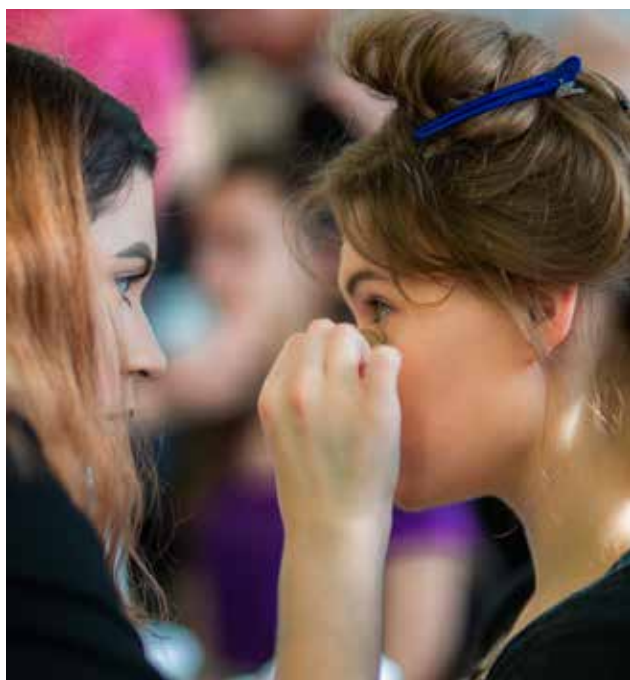
Priprava na modno revijo v okviru dogodka Srečanje šol

dobitev v zadnjem obdobju. Marsikaj je še načrtovano, bodisi za urejanje šole in okolice bodisi za posodobitev učne tehnologije. Le z moderno opremo, angažiranimi učitelji in prizadevnimi dijaki je lahko uspešna šola konkurenčna na trgu izobraževanja, kjer se vsako leto bije hud boj za novo vpisane dija-ke in obstoj šole.