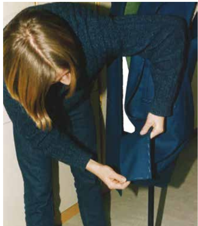
Šivanje in pomerjanje