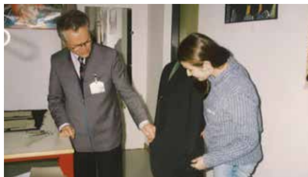
Pomerjanje na lutki