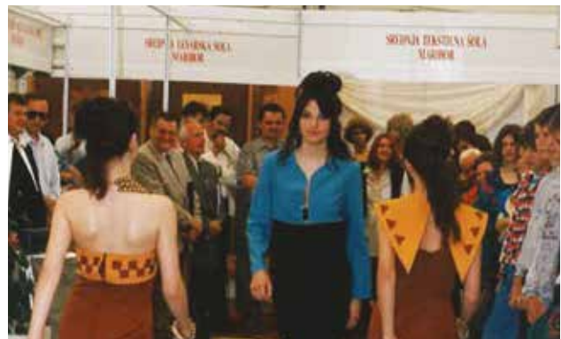
Predstavitve Srednje tekstilne šole z modno revijo