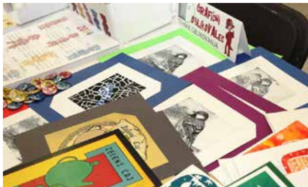
Predstavitve modula grafični oblikovalec