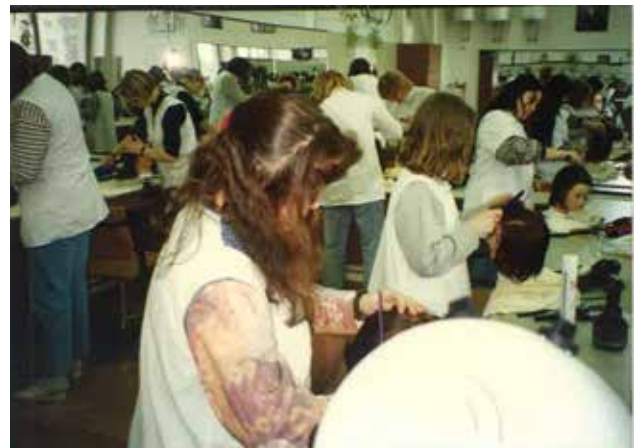
Praktični pouk dijakov programa frizer