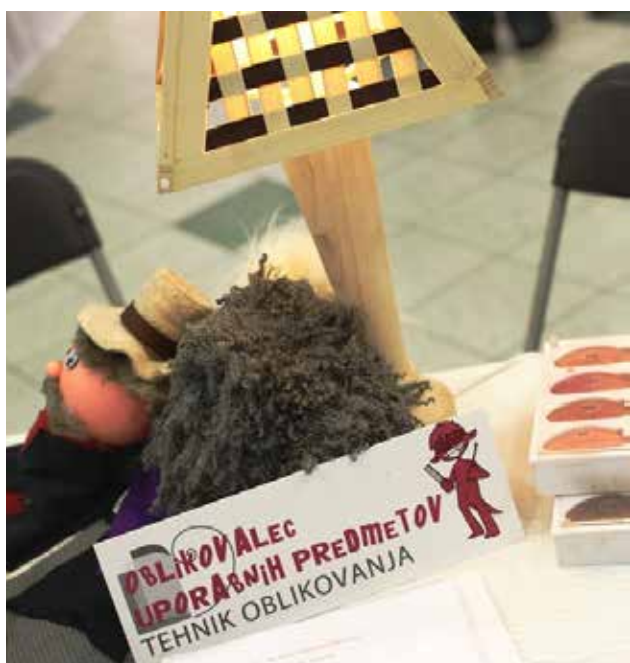
Predstavitve modula oblikovalec uporabnih predmetov

V programu SSI medijski tehnik je jeseni leta 2001 začelo izobraževanje prvih 32 dijakov/-inj.