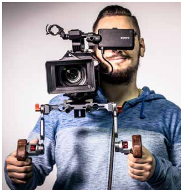
Sodobna oprema, namenjena za izvajanje programa medijski tehnik

Pridobljeni so številni novi učni pripomočki in strokovna literatura za šolsko knjižnico. Posodobili smo frizerske učilnice, prenovili šiviljsko delavnico. Določeni toaletni prostori so bili preurejeni v prostore, namenjene tuširanju. To je le nekaj posodobitev in pri-