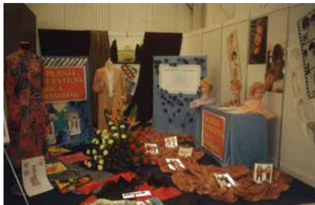
Razstava izdelkov zaključnih letnikov