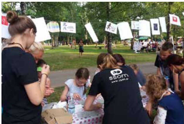
Sodelovanje in predstavitev programov SŠOM v Art kampu