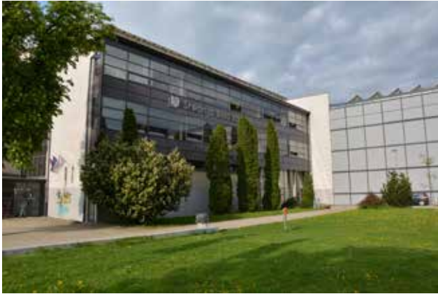
Glasbeno-plesna predstava dijakov Sledi svojim sanjam