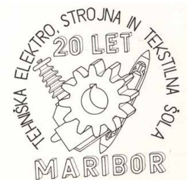
Simbol Tehniške elektro, strojne in tekstilne šole leta 1977