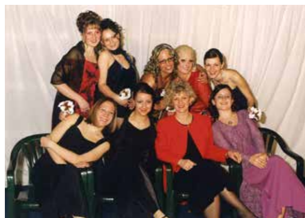
Veseli maturantje naše šole

Dijaki, ki so zaključevali izobraževanje, so se poslovili z maturantskim oz. zaključnim plesom. Sodelovali so tudi pri svetovnem rekordu v plesanju četvorke na Titovem mostu. Ob koncu vsakega šolskega leta so se dijaki zbrali in sodelovali na prireditvi Predaja ključa oz. glavnika. Nekaj let sta prireditvi potekali ločeno.