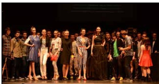
Zaključna predstavitev v Narodnem domu