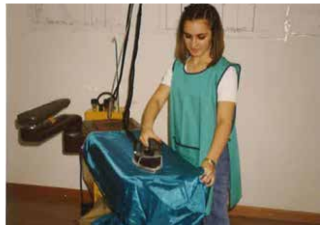
Dijakinja pri praktičnem pouku