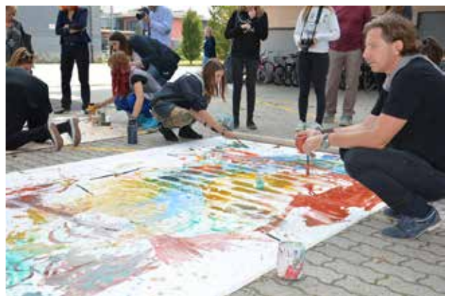
Obisk dijakov iz Šabca