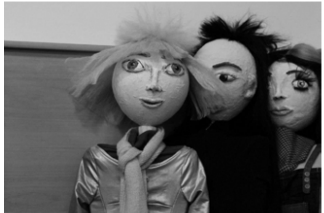
Mali princ na oblikovni