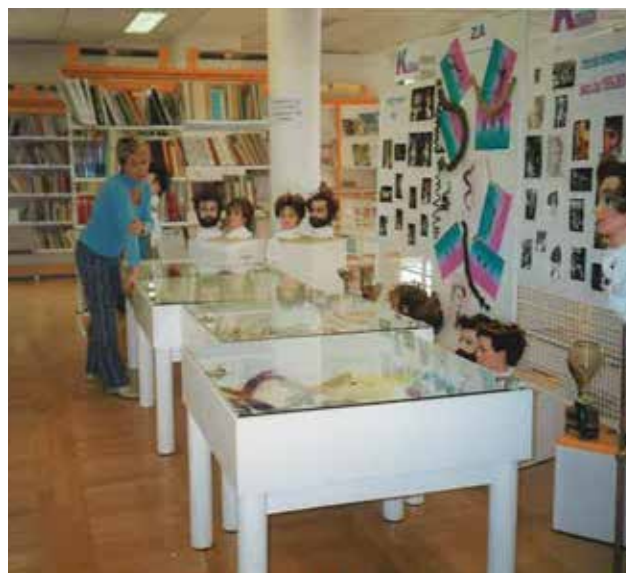
Razstava izdelkov v šolski knjižnici