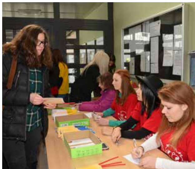
Sprejem bodočih srednješolcev na informativnem dnevu