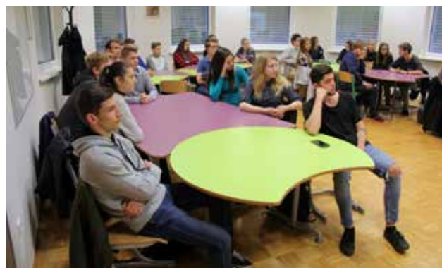
Dijaki pri projektu Spirit