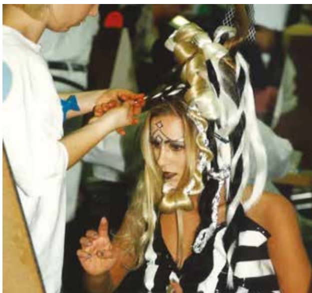
Priprave na modno revijo