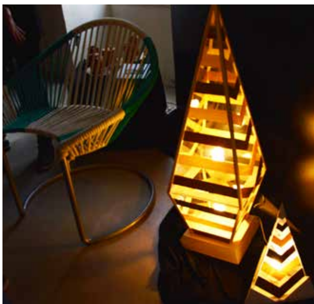
Izdelki dijakov zaključnih letnikov modula oblikovanje uporabnih predmetov

V jubilejnem letu ob sedemdeseti obletnici ga bomo organizirali že tretjič. FOMB je nov, svež koncept predstavitve stroke, ki ponuja seznanjanje z novostmi na področjih oblikovanja, medijev in frizerstva. Dijaki sodelujejo na različnih delavnicah v šoli. Vsak program ima v okviru festivala, ki poteka v Koloseju oz. Mariboxu, svoj dan, na katerem dijaki