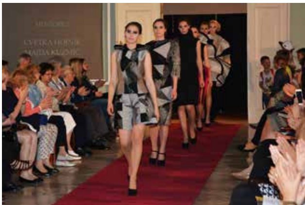
Modna revija Mesec mode