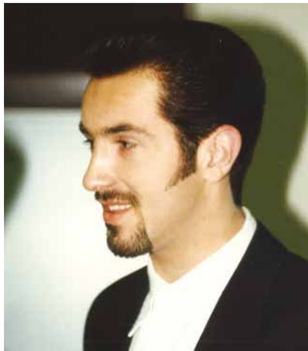
Model pri praktičnem pouku

V naslednjem obdobju, do šolskega leta 2005/06, se je število oddelkov zmanjševalo in se ustalilo pri 11 oddelkih – 280 dijakov/-inj. Izobraževali so se v smereh frizer, frizer (dualni sistem) in frizer (prenovljeni program).