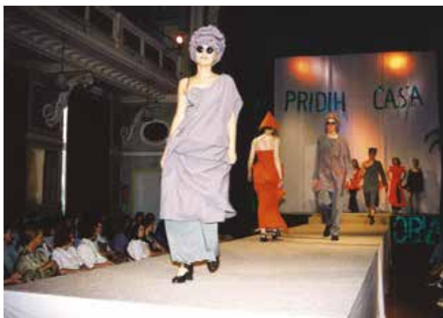
Šolska modna revija v Narodnem domu