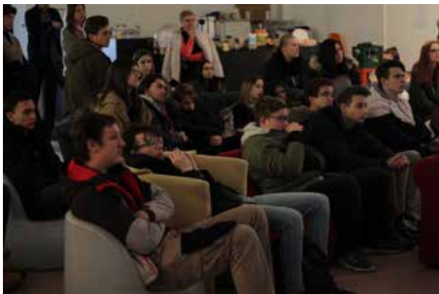
Dijaki programa medijski tehniki na dogodku MFRU in Kiblix 2016