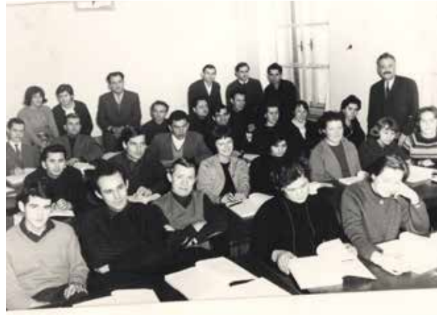
Modna modelarska šola, b razred 1965–66

la vse bolj verjetna. Tehniška tekstilna šola je bila ukinjena 18. julija 1972. Premoženje šole je bilo preneseno na Tehniško šolo za elektro in strojno stroko v Mariboru.