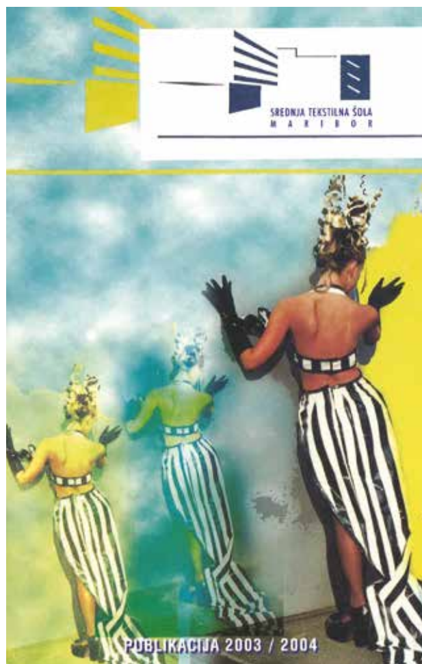
Publikacija Srednje tekstilne šole v šol. letu 2003/2004