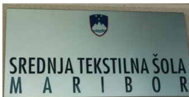
Napis nad vhodom v novo šol. zgradbo, Ulica Pariške komune 34