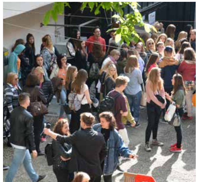
Odprtje razstave dijakov programa tehnik oblikovanja, modula grafično oblikovanje in oblikovanje uporabnih predmetov v Vetrinjskem dvoru