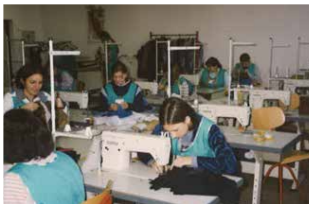
Dijakinje pri praktičnem pouku

V sklopu srednjega usmerjenega izobraževanja je v osemdesetih letih šola izvajala