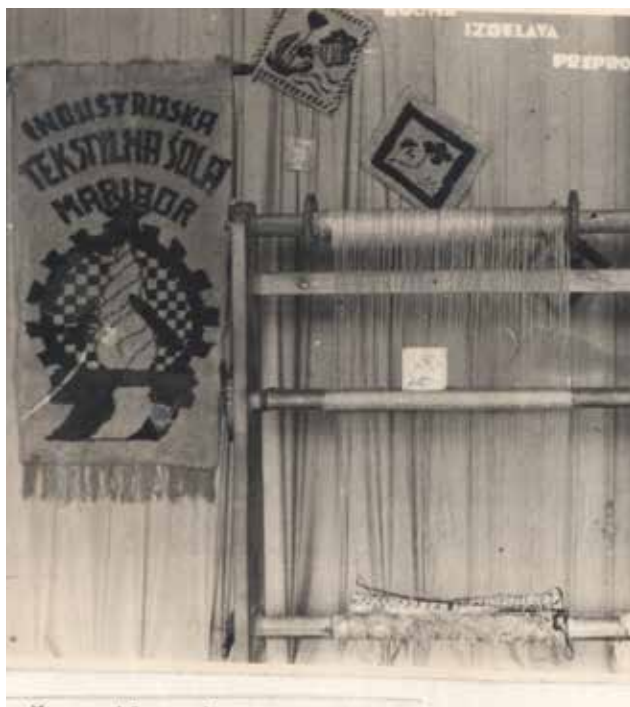
Ročno tkanje preprog z grbom Industrijske tekstilne šole Maribor

Sodobni stroji in sodobna tehnologija so zahtevali dodatno znanje strokovnega kadra. Nekateri so predlagali ustanovitev tekstilnega šolskega centra, v katerega bi se vključil oblačilni šolski center. Združitev s Tehniško šolo za elektro in strojno stroko je postaja-