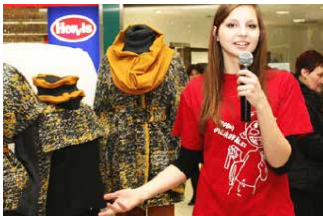
Predstavitve modula modni oblikovalec