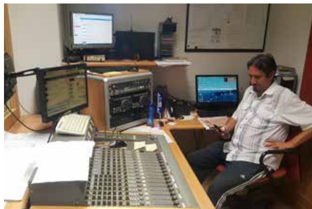
Praktično izobraževanje dijakov v Milanu