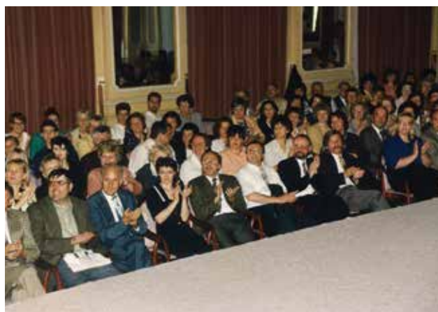
Obiskovalci zaključne prireditve v Narodnem domu