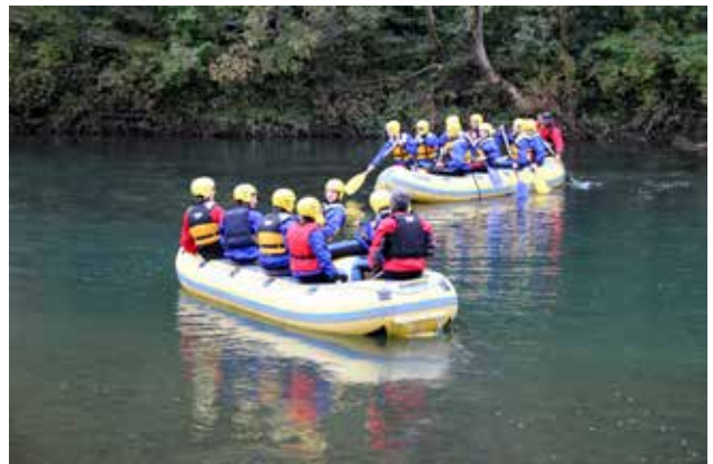
Športni vikend 3. letnikov