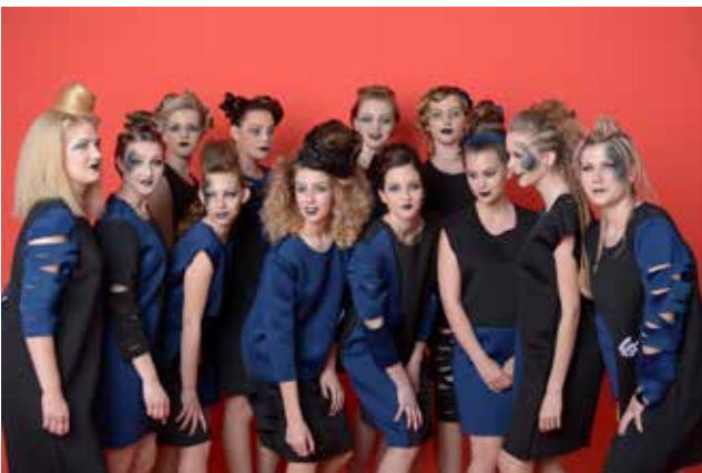
Modna revija na prvem Festivalu oblikovanja Maribor 2016