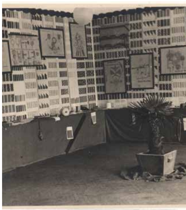
Razstava pri predmetu Tehnologija tkanja leta 1951