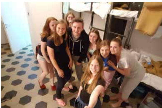
Dijaki na praksi v Milanu v okviru projekta mobilnosti Erasmus+