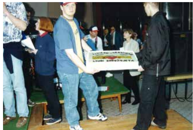
Prireditev Živilko in tekstilko pojeta