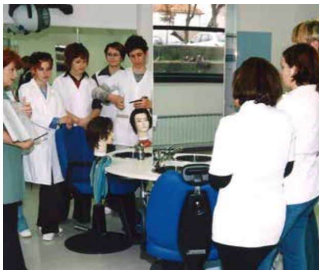
Pouk v frizerski delavnici

S Smetanove 18 so se v celoti preselili septembra 2002 na lokacijo Park mladih 8.