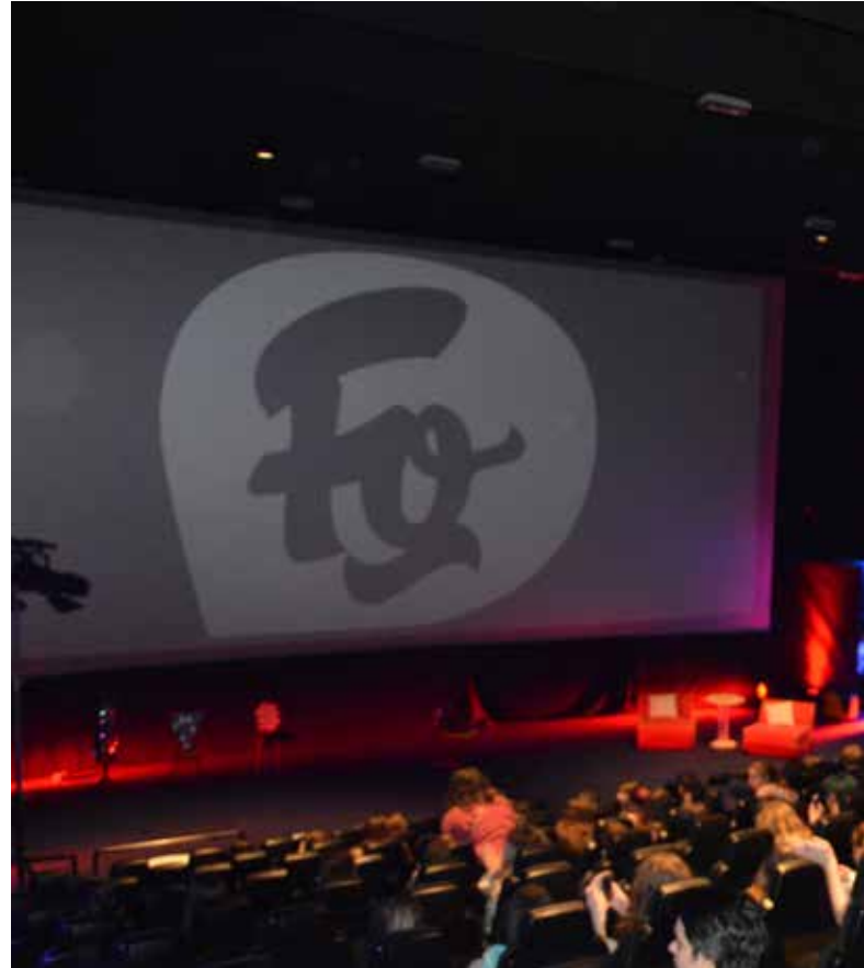
Festivalska dvorana v Mariboxu