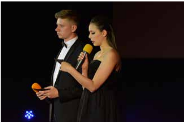
Zaključna prireditev SŠOM na Festivalu oblikovanja Maribor