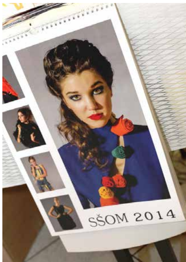
Predstavitve izdelkov programa medijski tehnik