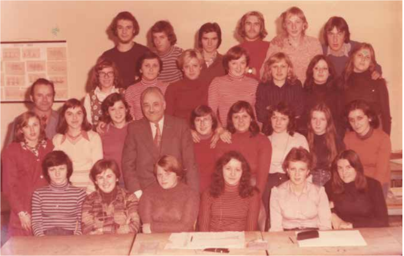
Tehniška elektro, strojna in tekstilna šola, konfekcijski oddelek 1976–77

Oblačilno in brivsko-frizersko šolo za kvalificirane delavce.