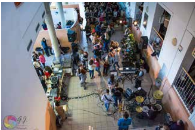
Božično-novoletni koncert v avli šole

tovitve, kakšne koristi bo prinesel posameznim partnerjem.