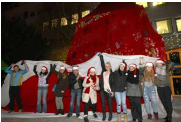
Zašili smo največjo božičkovo kapo na svetu in z njo prišli v Guinesovo knjigo rekordov.