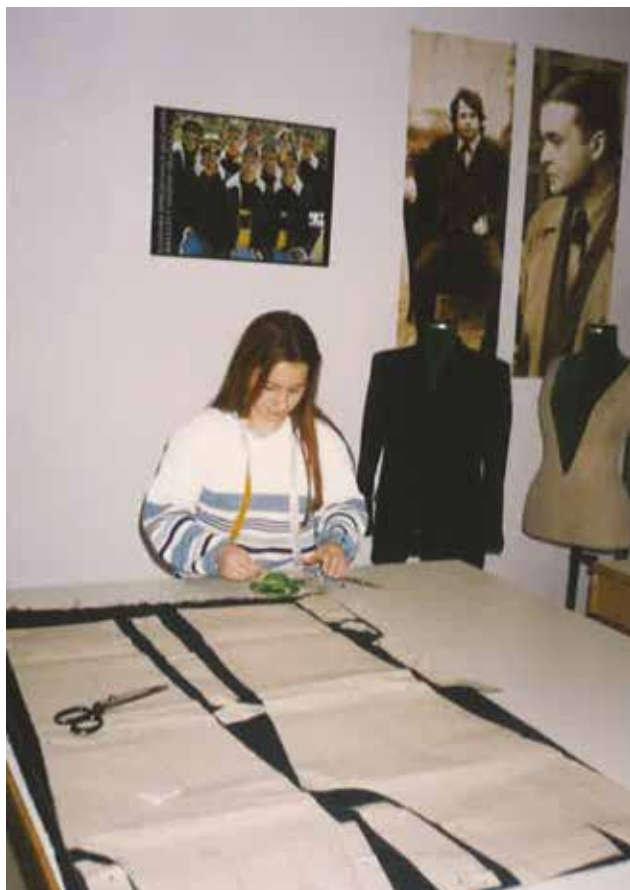
Priprava krojev pri praktičnem pouku

Praznovanja so se udeležili številni nekdanji dijaki, učitelji in sodelavci, tekstilni strokovnjaki, partnerji iz tekstilne industrije in šte-